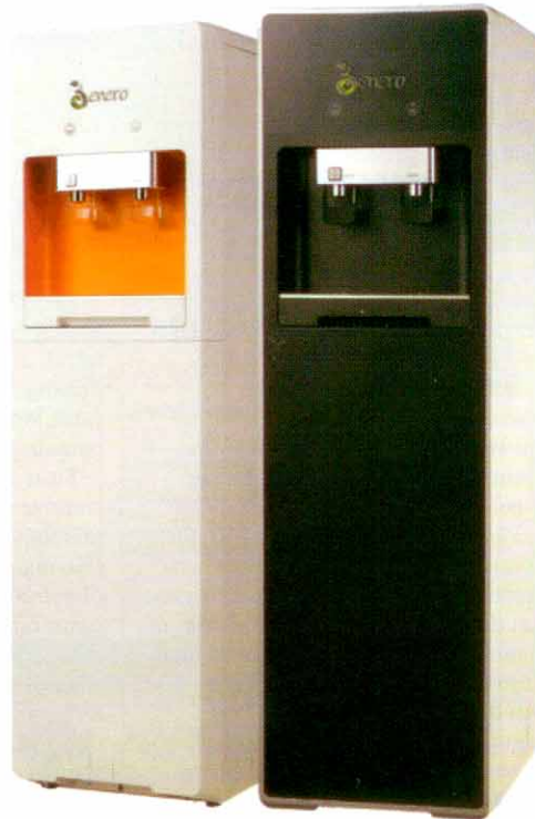
Mesin AirQua tipe keluarga / kantor